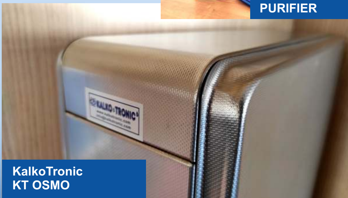
KalkoTronic KT OSMO

Sistemi innovativi del trattamento delle acque