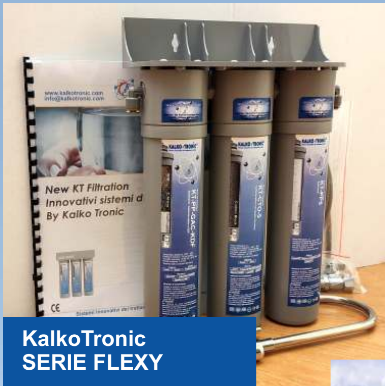
KalkoTronic SERIE FLEXY